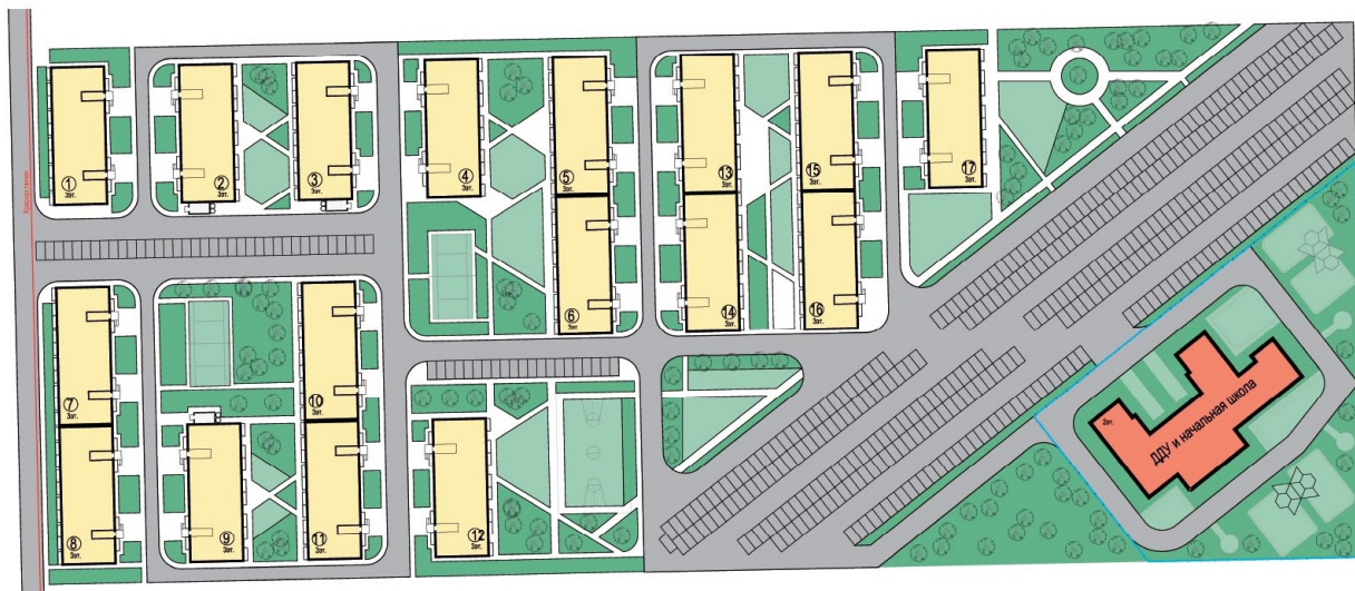
Схема планировочной организации земельного участка